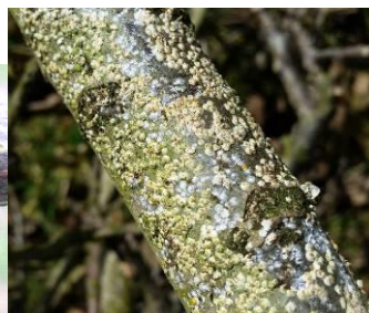
2-Boucliers blancs cachant les femelles