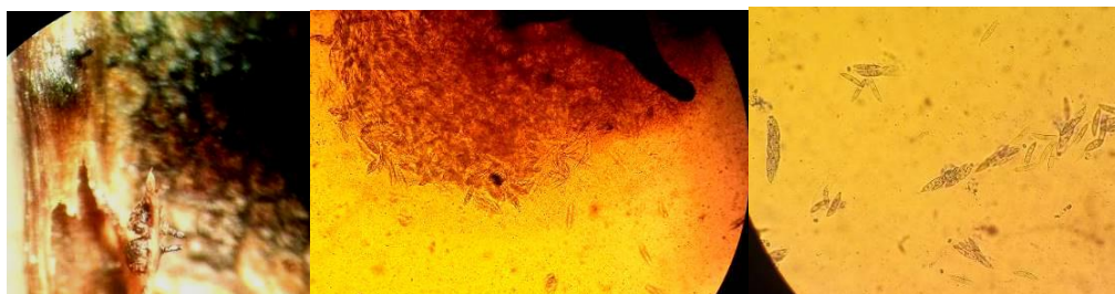
1-Périthèces vus à la loupe,

✚ Les contrôles biologiques de projections des ascospores débutent une fois le stade 6 de maturation des périthèces atteint ; au sein de notre réseau, ces contrôles sont réalisés grâce à un capteur de spores placé sur un lit de feuilles contaminées et non traitées sur le site de St Martial d'Albarède (24).