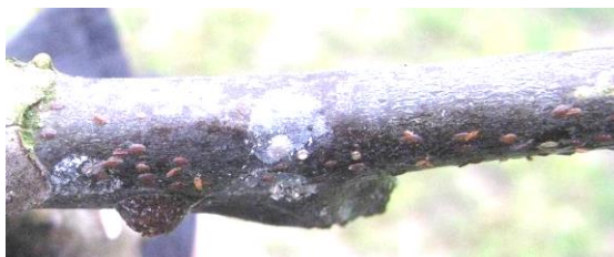
1-Larves de Lécanine du cornouiller,