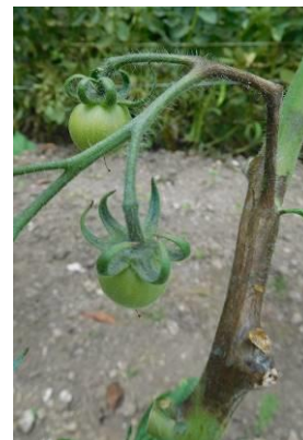
Mildiou sur tiges de tomate

Il est important de rappeler que l'aération des abris est essentielle pour limiter le risque mildiou. La présence d'une humidité importante associée à des températures élevées est nécessaire au développement de cette maladie.