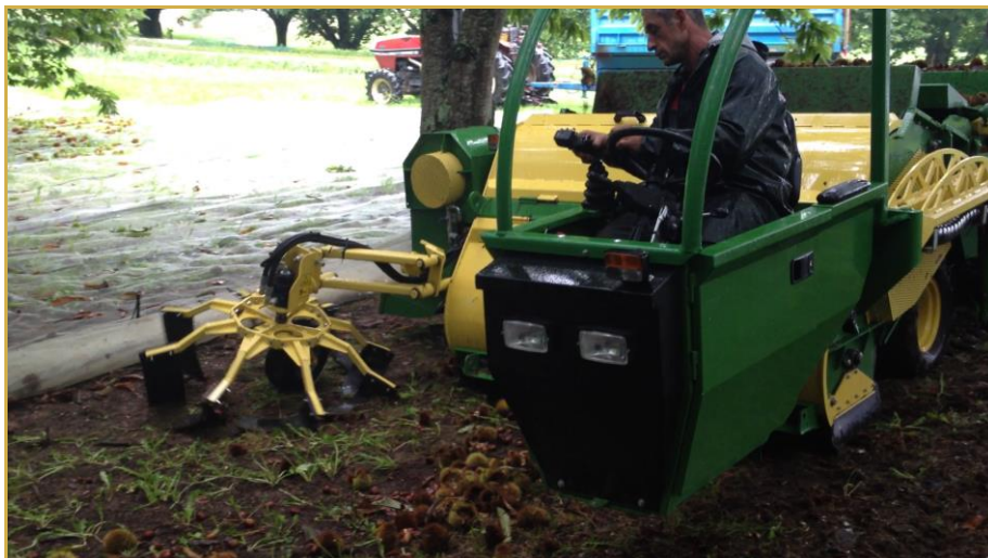
Quelle que soit la méthode adoptée, une récolte rapide est préconisée

Une récolte rapide et totale permet donc de limiter l'inoculum présent dans le verger.