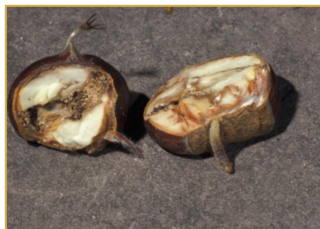
Le développement des larves peut être constaté en conservation