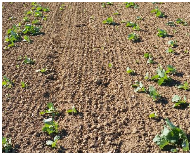
CDA 87 V LACORRE

Les colzas sont au stade « germination levée » BBCH05-09 à « 5 feuilles » BBCH15.