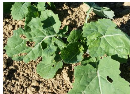
CDA 87 - V. LACORRE

Seuil indicatif de risque : les surfaces consommées sont supérieures au ¼ de la surface végétative.