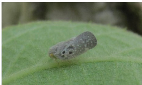
Adulte de Metcalfa