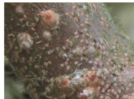
Larves de cochenille blanche

Le parasitisme par l'hyménoptère Neodryinus typhlocybae se développe. On observe la présence de larves parasitées (présence de kyste sous l'ébauche alaire de la larve de Metcalfa et cocon).