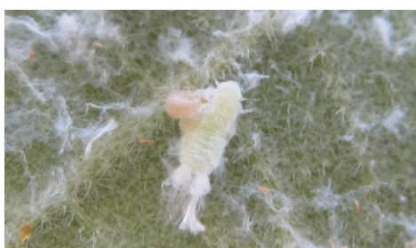
Larve de Metcalfa parasitée (kyste sous l'ébauche alaire)