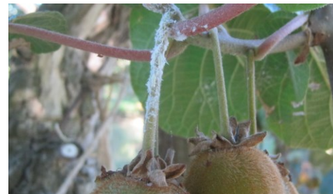
Larves de Metcalfa sur pédoncule

Mesures prophylactiques : afin de limiter son extension, les mesures prophylactiques telles que le débroussaillage des environs très propices (bords des cours d'eau avec ronces et orties...) et le broyage des adventices sont à privilégier.