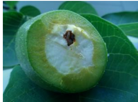
Larve à l'intérieur d'une noix.