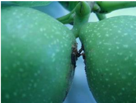
Excrément au point d'insertion de la larve entre 2 noix.

Les différents observateurs du réseau nous signalent la présence de dégâts en tous secteurs.