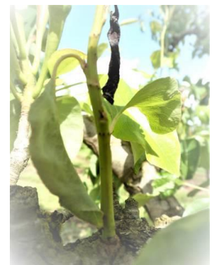
Dégât de cèphe

On observe sur quelques parcelles de référence des dégâts de cèphe sur jeunes pousses de poirier. Ces dégâts sont très caractéristiques : séries de blessures disposées en spirale formant de petites nécroses noires qui entravent la circulation de la sève. Les jeunes pousses fanent, se recourbent en crosse et se dessèchent (ne pas confondre avec les symptômes du Feu bactérien). Ces blessures sont causées par la femelle lors de la ponte.