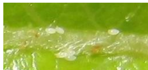
Œufs de psylle

Seuil indicatif de risque : à cette période de l'année, le seuil de nuisibilité est de 10-20% de pousses occupées par de jeunes larves. En présence de punaises prédatrices telles que Anthocoris et Orius (15-20 individus pour 50 frappages), ce seuil est porté à 30%.