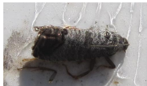
Carpocapse des pommes

La période à risque vis-à-vis des pontes débute lorsque les températures crépusculaires sont supérieures à 15°C pendant 2 jours consécutifs avec des conditions sèches.