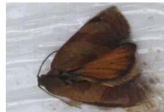
Tordeuse de l'œillet