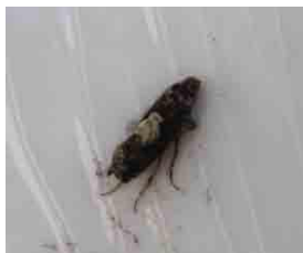
Adulte de Pammene sp

A cette période de l'année, des papillons comme Pammene sp et Epiblema scutulana peuvent être occasionnellement piégés dans les pièges tordeuse orientale. Pammene se différencie par la présence d'une tache nette de couleur blanche à l'intersection des ailes supérieures et Epiblema par une taille supérieure et une couleur blanche dominante sur les ailes. Soyez donc attentifs lors du relevé des pièges afin de ne pas comptabiliser ces papillons.