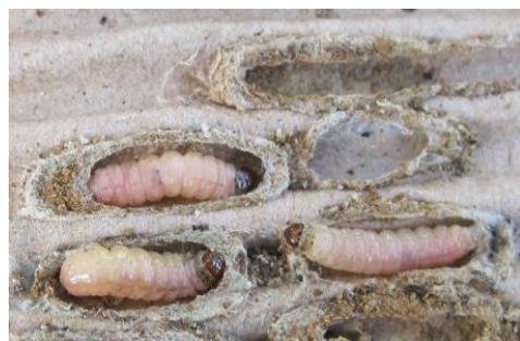
Larves de carpopapse des pommes