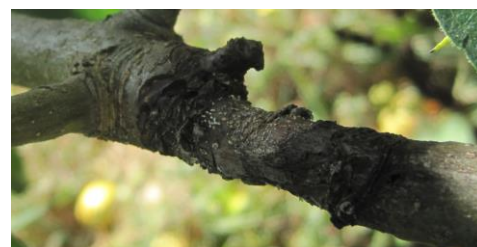
Chancre à nectria

Les contaminations ont lieu lors de périodes humides. Les plaies de cueillette et la chute des feuilles constituent des portes d'entrée non négligeables pour le champignon.