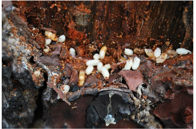
Galleries de sténographe avec larves, immatures et adultes de sténographe (photos DSF prises le 13/10/2022 La Teste-de-Buch)