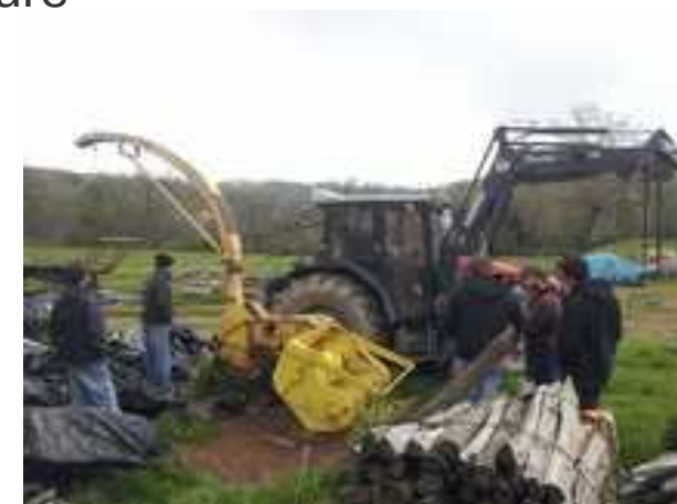
Photo du « dragon », une ensileuse qui a prit feu lors du broyage du chanvre