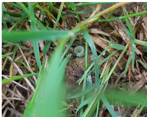
Chenille à JUXUE

Une seule chenille mais de taille plus importante (environ 1,3 cm) a été vue à MACAYE.