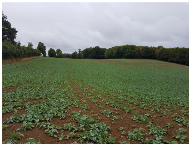
V.LACORRE - CDA87 - Colza parcelle Nexon

Les colzas sont au stade « germination levée » BBCH05-09 à « 8 feuilles » BBCH18.