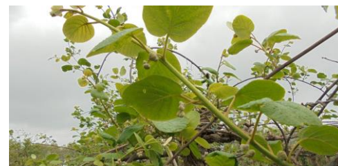
« Boutons floraux dégagés »

Variété à chair jaune : stade « boutons floraux dégagés » (BBCH 53).