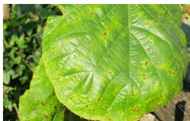
Nécroses sur feuilles

Les conditions douces et sèches ne sont pas favorables à la bactérie. La surveillance des parcelles doit cependant être maintenue.