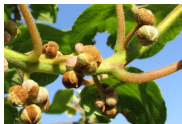
Nécroses de boutons