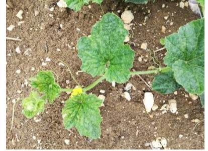
Symptômes de virose

Les premiers symptômes de viroses sont observés sur le réseau.