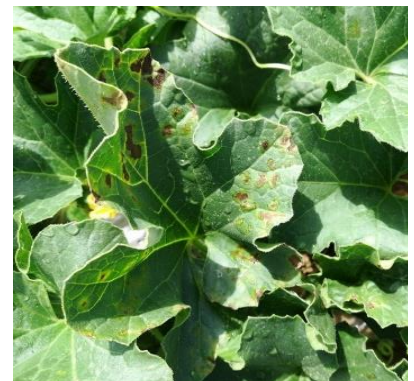
Symptômes de mildiou