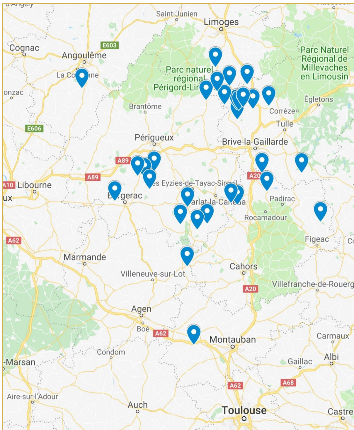
Répartition des communes présentant un ou plusieurs sites de piégeage de Cydia splendana en 2019 Réseau BSV Grand Sud-Ouest

Si vous souhaitez participer à ce réseau de suivi du vol du carpocapse de la châtaigne, n'hésitez pas à contacter directement l'animateur de la filière BSV : raphael.rapp@na.chambagri.fr