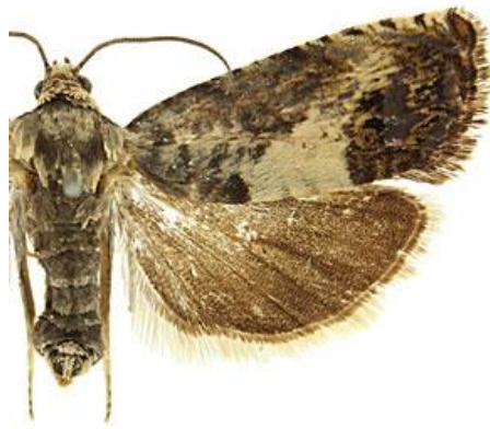
← Adulte mâle de Pammene fasciana (tordeuse)