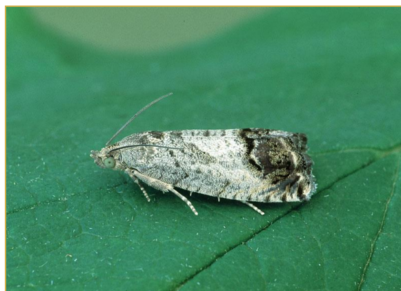
Forme adulte de Cydia splendana