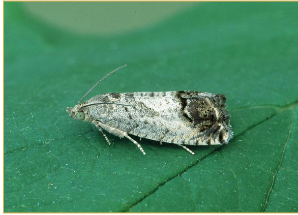
Forme adulte de Cydia splendana