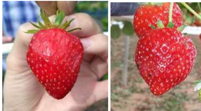
Dégât sur fraise

En Lot-et-Garonne , la pression Drosophila suzukii reste très forte, entraînant dans certain cas l'arrêt de parcelle.