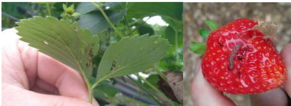
Dégât de Duponchelia fovealis sur feuille et sur fruit

La période à risque débute, les larves du deuxième vol commencent à faire des dégâts sur les nouvelles plantations.