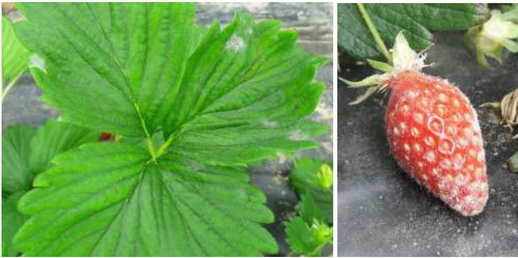
Oïdium sur feuille et fruit