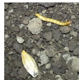
Larve de Taupins près d'un grain d'orge

Observations : en parcelles de référence, signalement de faibles attaques sur la parcelle de Saint Médard de Guizières protégée. Sur la parcelle de référence non protégée de Pontacq (64), le niveau d'attaque atteint 16%. Dans le tour de plaine, à Saint Laurent Médoc (33), on nous signale une forte attaque de taupins (situation non protégée) avec 40% de perte de pieds. Des attaques sont signalées à Bougarber (64).