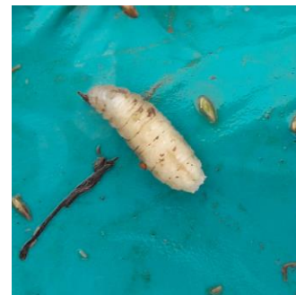
Larve de la mouche des semis

Le retour de la chaleur permettrait aux maïs de pousser plus rapidement et donc de limiter la pression du ravageur.