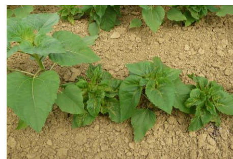
Mildiou sur tournesol.