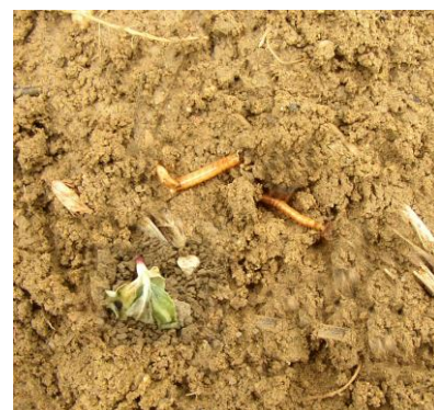
Larves de taupin et plant de tournesol attaqué.

Pour en savoir plus sur le Mildiou, consultez le site Terres Inovia avec le lien suivant : http://www.terresinovia.fr/tournesol/cultiver-du-tournesol/maladies/mildiou/moyens-de-lutte/