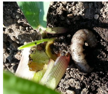
Photo : vers gris