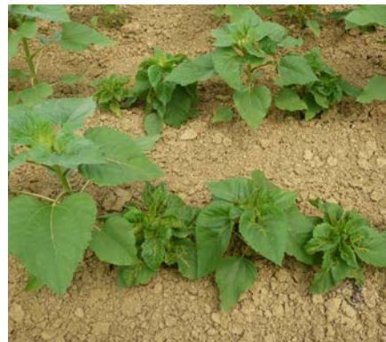
Mildiou sur tournesol.

http://www.terresinovia.fr/tournesol/cultiver-du-tournesol/maladies/mildiou/moyens-de-lutte/