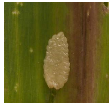
Oeufs de pyrales

Observations : cette semaine, on enregistre des captures sur 3 des 8 pièges relevés dans le Nord33 Entre deux mers, Sud47 et Sud Adour. Depuis le 4 juin, en cage d'élevage de notre partenaire, les pyrales sont en pleine émergence. Dans les cages d'élevage d'Arvalis à Montardon, on observe toujours des pontes d'œufs sans éclosion pour le moment.