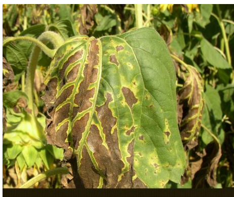
Verticillium sur tournesol :

Attention à la confusion avec les symptômes liés à une carence en bore :