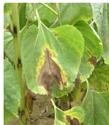
Symptômes de phomopsis sur feuille

Période à risque : stade limite passage tracteur (stade E1-E2).