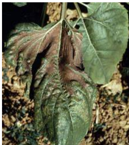
Carence en bore sur tournesol :

Petites taches jaune vif sur feuilles basses puis chlorose inter-nervaire plus ou moins large. Les tissus finissent par brunir et mourir. Les nervures restent vertes.