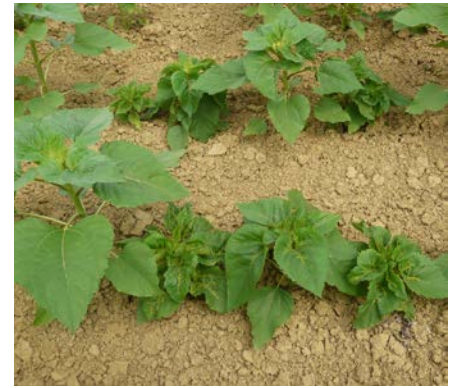
Mildiou sur tournesol (photo Terres Inovia).

Si vous rencontrez des situations avec un taux d'attaque significatif (>5% de pieds touchés en moyenne sur la parcelle), contactez Terres Inovia ou la FREDON Aquitaine (05.56.37.94.76) afin de réaliser un prélèvement pour déterminer la race présente