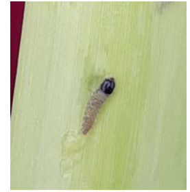
Larve de pyrales

En vallée de Garonne (Langon), les dégâts causés par les larves sont visibles dans une parcelle prospectée (à une fréquence de 3% pour le moment).