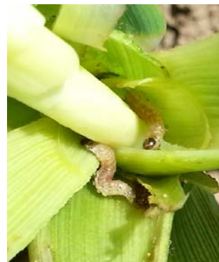
Larves de sésamies

La fin du vol de sésamies de 1 ère génération est attendue pour la fin juin à début juillet pour l'ensemble des secteurs aquitains. Le début de celui de 2 ème génération devrait démarrer à partir du 8 juillet.