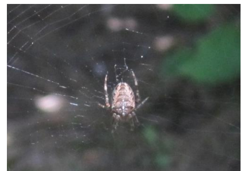
Araignée Epeire

Les structures partenaires dans la réalisation des observations nécessaires à l'élaboration du Bulletin de santé du végétal Nouvelle-Aquitaine Kiwi sont les suivantes : Cadralbret, CDA 47, FDGDON 47, FDGDON 64, Garlanpy, Rouquette, SCAAP Kiwifruits de France, Vallée du Lot