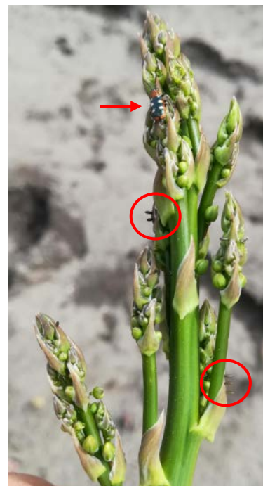
Criocère adulte + œufs sur asperge

Il existe un seuil à partir duquel il est risqué de laisser les populations se développer sur les stades juvéniles de l'asperge. Ce seuil est estimé à 3 criocères pour 10 mètres linéaires de rang (source Adar Blayais). Ce seuil est atteint dans certaines parcelles du Blayais.