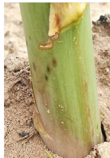
Stemphylium sur asperge

Seuil indicatif de risque : parcelles en végétation.