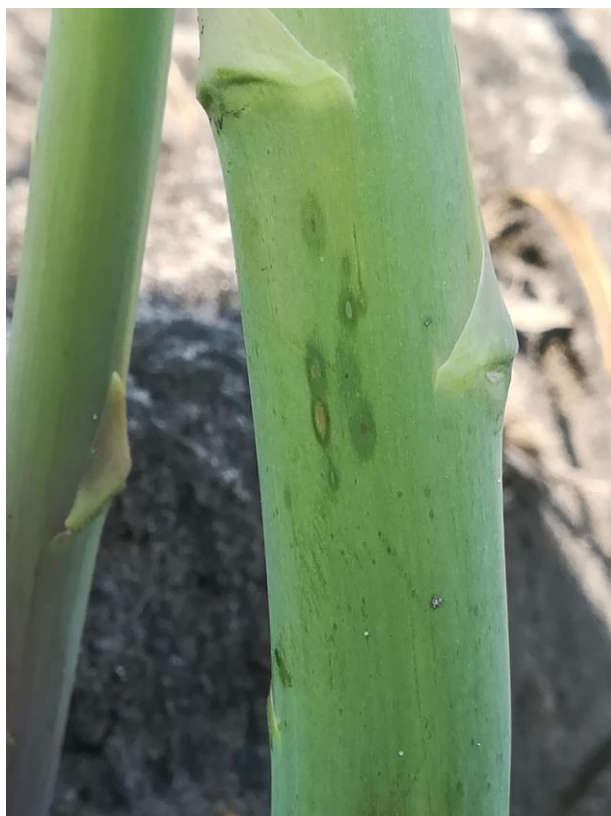
Stemphylium sur asperge