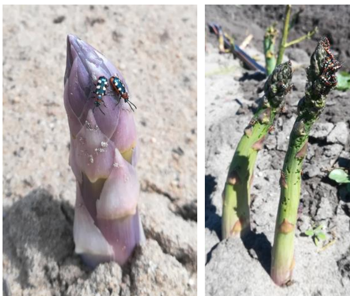
Criocères adultes sur asperge

Dans le Blayais, des adultes et des œufs sont présents sur 35 ha d'asperges vertes en récolte et non récoltées (plantations 2018), dont 10 ha avec plus d'un individu par mètre linéaire.