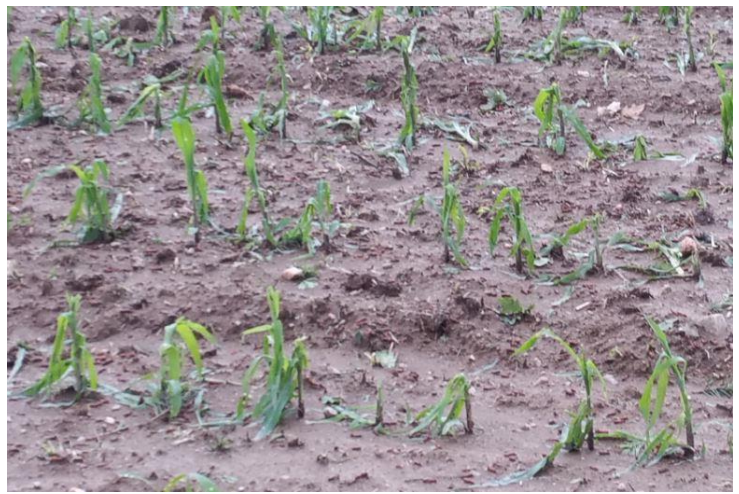
Cda 87 - V. LACORRE