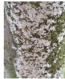
Boucliers blancs cachant les femelles Follicules mâles