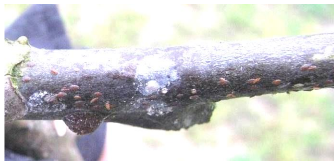
Larves de Lécanine du cornouiller et bouclier protégeant une femelle.

La présence de larves hivernantes a été repérée sur des charpentières de quelques arbres dans plusieurs parcelles du bassin de production (Corrèze, Dordogne et Lot). L'observation de ce stade larvaire (voir photo ci-dessus) nécessite l'utilisation d'une loupe. On peut aussi détecter la présence de cette cochenille par l'observation de vieilles carapaces brun acajou laissées par les femelles au cours de la campagne précédente.