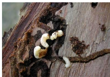
Larves de scolyte