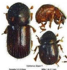
Adultes de Xyleborus dispar