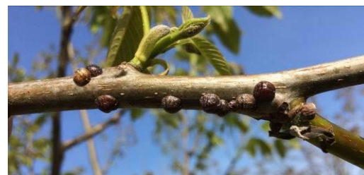
Boucliers de Lécanine du cornouiller

On observe des œufs et des larves sous les boucliers rougeâtres de Lécánines du Cornouiller. De plus, on remarque en secteurs précoces (Lot-et-Garonne) les toutes premières migrations.