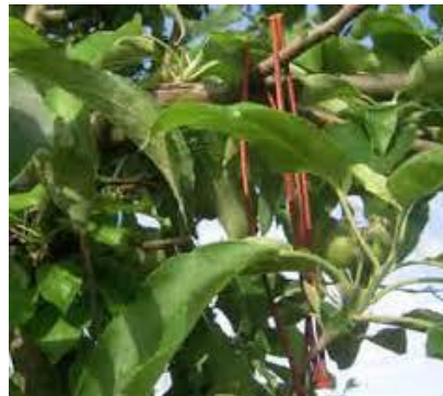
Diffuseurs posés dans le cadre la gestion du carpocapse par confusion sexuelle