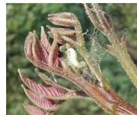
Chenille défoliatrice

Les chenilles défoliatrices sont des larves de papillon pouvant appartenir à différentes familles comme les tordeuses ou les arpen-teuses. En général, ces chenilles sont actives tôt dans la saison, depuis le stade du débourrement avancé jusqu'à la mi-juin.