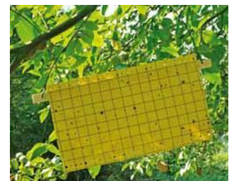
Plaque piège pour la mouche du brou

Le piège fera l'objet d'un relevé hebdomadaire jusqu'à la fin du mois de septembre.