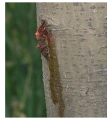
Dégât de larves de zeuzère

Les orifices de pénétration des larves sont marqués par de petits tas de sciure et d'excréments (en forme de petits cylindres) accompagnés d'écoulement de sève, particulièrement visibles sur les grosses branches (voir photo ci-contre).