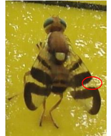
Rhagoletis completa

Rhagoletis completa , petite mouche d'environ 6 mm originaire de l'Amérique du Nord, n'a qu'une génération par an. Le vol, d'une semaine environ, s'étale de fin juin à début septembre. La femelle pond, 4 à 7 jours après l'accouplement, 300 à 400 œufs à raison d'une quinzaine par fruit. Un marquage olfactif du fruit ayant déjà reçu des pontes explique que chaque mouche est capable de contaminer plus d'une vingtaine de fruits. L'incubation des œufs prend 5 à 10 jours et le développement larvaire se poursuit durant 3 à 5 semaines dans le brou de la noix. Les larves tombent ensuite au sol et s'enfouissent de quelques centimètres pour y hiverner sous forme de pupes.