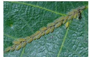
Callaphis juglandis

Des populations importantes peuvent donc entraîner la diminution du calibre des noix et/ou nuire à la qualité du cerneau.