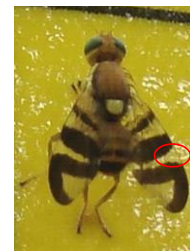
Rhagoletis completa

Des larves sont observées dans les noix en tous secteurs.