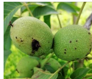
A gauche, dégât de larve de carpocapse

D'après les données du réseau de piégeage du BSV et celles fournies par les coopératives partenaires, une hausse des captures a été constatée dans la deuxième quinzaine du mois d'août. Il s'agit très probablement du vol de la 3 ème génération de carpocapse qui s'observe aussi bien dans les secteurs précoces qu'intermédiaires (départements 19, 24 et 46).