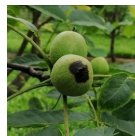
Symptôme de bactériose

Des taches de bactériose sont observées sur des feuilles et des fruits dans plusieurs secteurs.