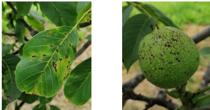
Symptômes d'anthracose sur feuille et sur fruit

Ces symptômes peuvent être dus à Gnomonia leptospyla , mais aussi à Colletotrichum sp.