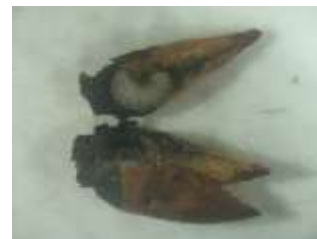
Larve d'anthomome du poirier

Sur une parcelle de référence, il a été observé des bourgeons desséchés avec présence de larve d'anthomome.