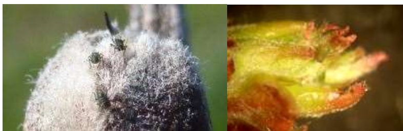
Fondatrices de puceron cendré (photo 1) et puceron vert (photo 2)