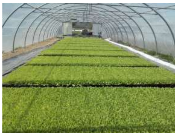
Stade premier faucillage sur semis Burley