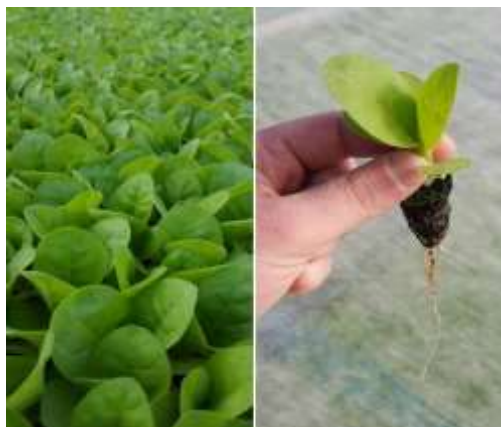
Stade 4 feuilles vraies

D'une manière générale, les plants sont sains. Des plants malades, présentant du botrytis, ont toutefois été observés sur deux parcelles de référence dans les secteurs d'Aussevielle (64) et d'Amuré (79). Dans le secteur de Saint Pierre d'Eyraud, la germination est bonne (>90%). Des irrégularités ont été relevées sur le Virginie dans les secteurs de Masseube (32) et de Cuzorn (47).