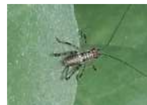
Sauterelle sur plant de tabac

Des sauterelles ont été observées dans la zone de La Fouillade (12), mais sans dégâts sur les plants.