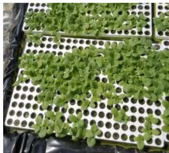
Dégâts de limaces sur semis