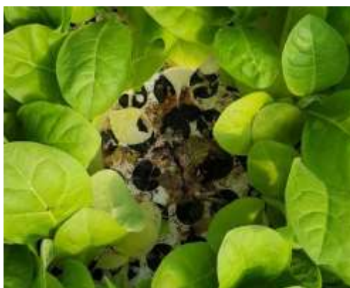
Botrytis sur plant de Tabac

Des traces de Botrytis ont été observées sur les plants dans les zones de Vivonne (86) sur 65 ha et des dégâts liés à ce champignon dans cette même zone ont également été détectés sur environ 30 ha ainsi que dans le secteur d'Aizenay (85) sur 130 ha.