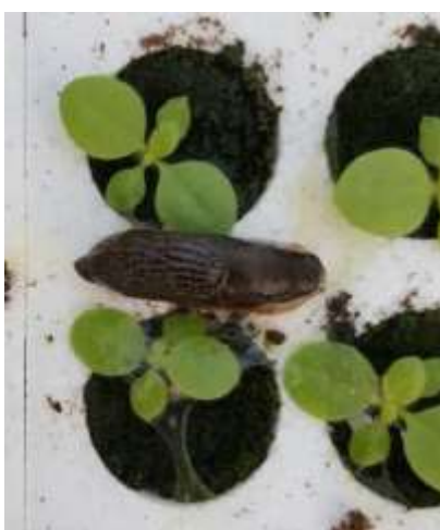
Limaces sur semis

La présence de limaces et les dégâts qui y sont associés sont observés avec parfois des attaques importantes. Surveillez vos bacs.