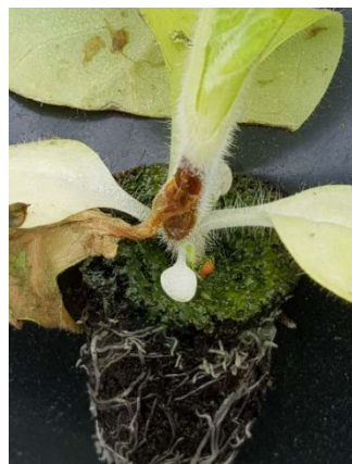
Botrytis sur plant de tabac