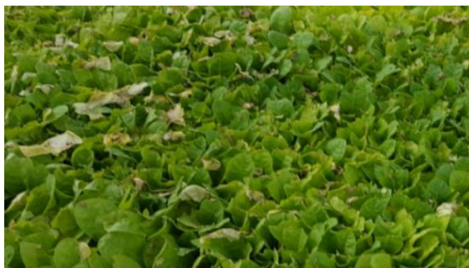
Plants atteints d' Olpidium