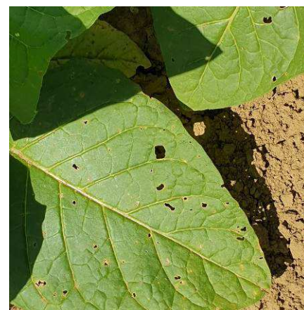
Dégâts altises sur feuilles de tabacs

Des altises ont été observées en tour de plaine dans le secteur de Beauville (47) sur 7 ha avec une fréquence d'attaque de moins de 20 %. Présence de nématodes dans deux secteurs, sur 10 ha pour celui de Blaignac (33) et sur 1 ha avec des dégâts inférieurs à 20 %.