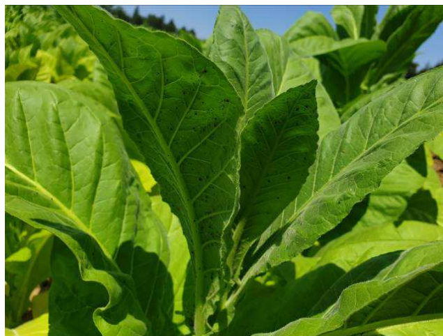
Nombreux pucerons sur plant de tabac

En progression en tour de plaine, les pucerons continuent leur développement allant de 4 à 6 ha dans plusieurs secteurs dont Pujo (65), Beaurepaire (38) et Sanvensa (12). On observe leur présence sur 10 ha pour la zone de Blaignac (33). Ils sont signalés avec une fréquence d'attaque de moins de 20 % sur 4 ha pour la zone de Beauville (47) et l'on note des symptômes sur 25 ha pour celle de Chemillé (49) avec des dégâts de moins de 20 % sur 16 ha. On observe des symptômes sur 75 ha pour le secteur de Saint-Memmie (51) et sur 45 ha pour celui de Vivonne (86) avec des dégâts de moins de 20 % sur 18 ha.