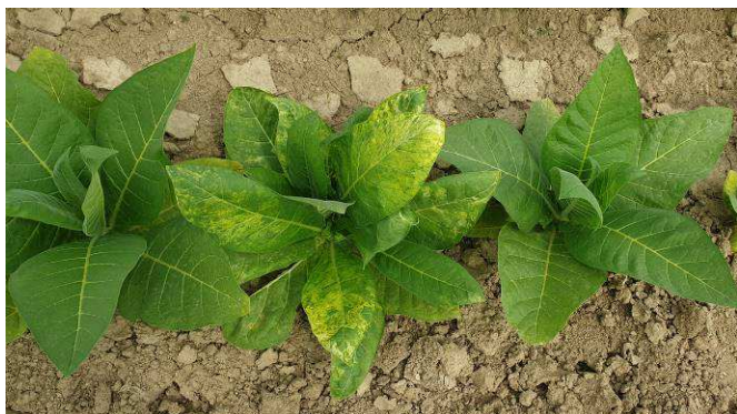
Viroses sur plants de tabacs

En parcelle de référence, on observe des viroses AMV, CMV, TMV allant de l'ordre de 1 % sur la zone de Sanvensa (12). Pour le virus PVY, on le signale de l'ordre de 1 % sur les secteurs de Lapeyrousse-Mornay (26) et Saint-Ignat (63). On note également sa présence de l'ordre de 5 à 10 % pour les zones de Sanvensa (12), Loivre (51), Fontaines (85) et Amuré (79).