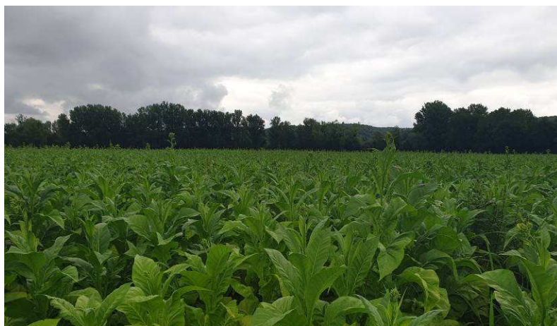
Tabacs en inhibition

Ce BSV a été rédigé avec des informations collectées sur 10 parcelles de références et sur 1 022 ha pour les tours de plaine.