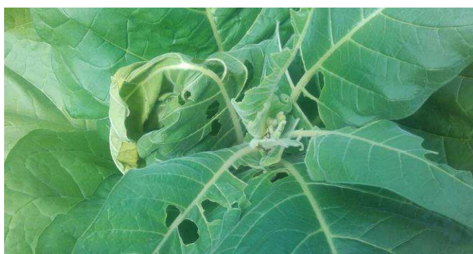
Punaises et leurs dégâts sur plant de tabac