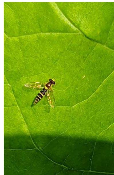
Syrphe sur feuille de tabac

Les syrphes sont présents sur 3 ha pour le secteur de Sanvensa (12) et sur 5 ha pour le secteur de Beauville (47). Ils sont présents sur 15 ha dans la zone de Thuret (63) et sur 10 ha pour celle de Beaurepaire (38). On les note sur 50 ha pour le secteur de Chémillé (49) et 60 ha pour Vivonne (86) où ils régulent leurs proies. Les apparitions de chrysopes et hémérobes s'observent sur 20 ha sur les secteurs de Vivonne (86), Chemillé (49) et sur 1 ha pour Sanvensa (12).