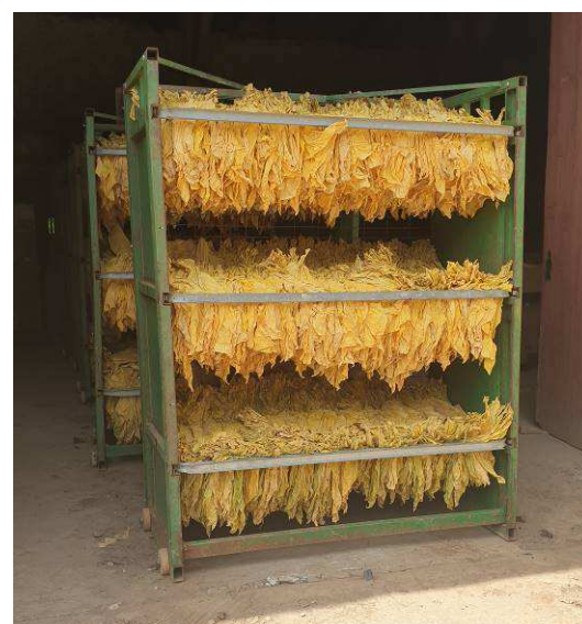
Tabacs au stade début de récolte de Virginie 20 %

Pour la zone du Puch d'Agenais (47), l'écimage est en cours après les deux premières inhibitions, alors que celui-ci est terminé pour la zone de Saint-Ignat (63) qui prévoit une récolte pour le 15 août. Le Burley est lui aussi en cours d'inhibition et l'on note le premier ramassage de la cueillette de tabacs Virginie pour le secteur de Cuzorn (47). Avec les températures froides et le manque de soleil, on observe que les fleurs de tabacs mettent plus de temps à sortir et le tabac semble stagner au stade bouton dégagé pour le secteur de Castetpugon (64). Des captures d' Agrotis ipsilon et segetum sont enregistrées sur la parcelle de référence de Saint-Ignat (63).