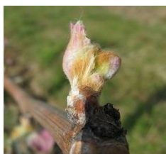
Stade D06- Eclatement du bourgeon

Rappel : Stades de forte sensibilité à observer sur les 2 premiers bourgeons de la base :