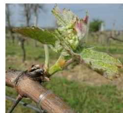
Stade E 09- 2 à 3 feuilles étalées

Les bourgeons les plus proches du vieux bois sont plus particulièrement exposés aux contaminations.