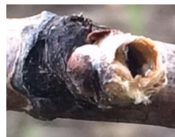
Bourgeon évidé en œuf à la coque

Quelques dégâts de mange-bourgeons sont observés sur quelques parcelles (Cf. photo). Avec la remontée des températures, la végétation de la vigne va rapidement évoluer et diluer leur impact.