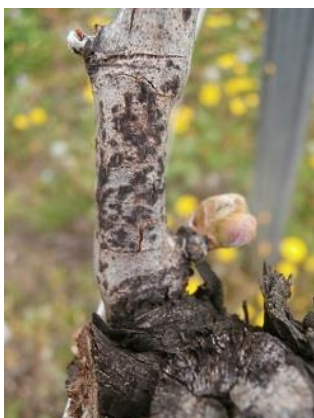
Symptômes d'excoriose discrets mais étranglement à la base du rameau

Il est important d'évaluer sur votre vignoble le niveau d'attaque sur les bois laissés à la taille. L'opération consiste à compter les bois laissés à la taille (astes et cots) présentant des symptômes (cf. photo des symptômes). Réaliser un comptage sur 50 cep. Les symptômes sont situés à la base des rameaux (en général sur les 3 premiers entre-nœuds) sous forme de nécroses brunâtres peu profondes, en forme de fuseau et de lésions étendues d'aspect ligneux ou de blanchiment des rameaux avec des ponctuations noires (pycnides).