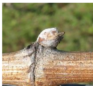
Bourgeon dans le coton (B-03)

En revanche, il peut être observé, sur certaines parcelles (fonction du diamètre des sarments, des cépages,...) et sur des secteurs plus précoces, un stade plus avancé avec présence, parfois, de 1 à 2 feuilles étalées, en bout de latte.