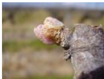
Pointe verte (C-05)