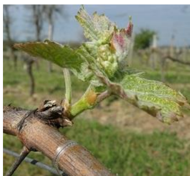
Stade E 09- 2 à 3 feuilles étalées