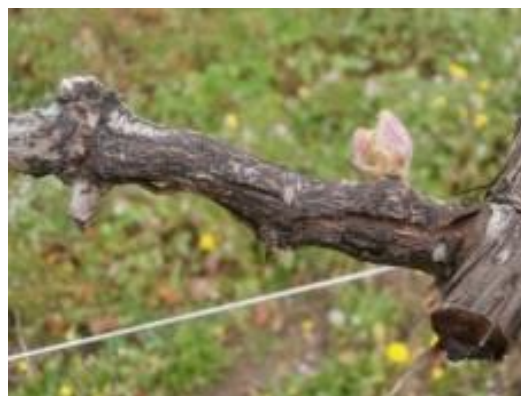
Symptômes sévère d'excoriose