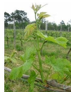
6 à 7 feuilles étalées (F-13)