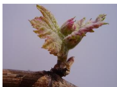
1 à 2 feuilles étalées (E-08)

En revanche, nous observons toujours, sur des parcelles isolées et abritées, et sur secteurs plus précoces un stade plus avancé « G15- 7 à 8 Feuilles étalées ».