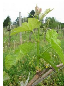
5 feuilles étalées-grappes visibles (E-11)