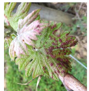
Symptôme d'Erinose

Les symptômes d'Erinose sont régulièrement observés mais restant de faible intensité. Ponctuellement, ils peuvent être plus importants. Ces symptômes sont sans grande conséquence pour la vigne mais plutôt un problème d'esthétisme. La pousse de la vigne va diluer sa présence.