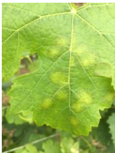
Nouveaux Symptômes sur feuille

📖 Consultez la fiche « mildiou » du Guide de l'Observateur