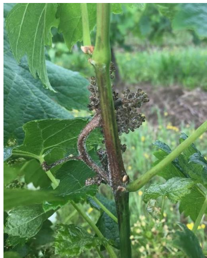
Symptôme sur inflorescence et sur rameau (Témoin non traité)