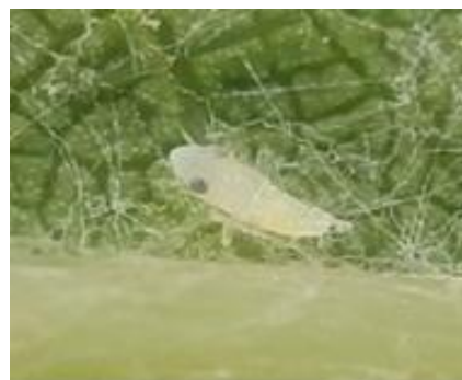
Larve de cicadelle verte (Empoasca vitis)