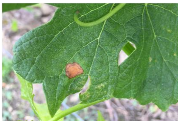
1 tache de Black rot avec pycnide

De nouvelles taches néoformées ont été encore observées cette semaine sur l'ensemble du vignoble, à la fois sur Témoin non traité et sur des parcelles de référence traitées. Elles sont toujours de faible fréquence (<3%) et intensité (<1%). Les foyers, signalés la semaine dernière, ont peu évolué.