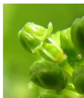
Début Floraison (I-20)

Sur des parcelles isolées et abritées, et sur secteurs plus précoces, nous observons déjà le stade Grain de plomb.