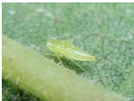
Larve de cicadelle de la Flavescence dorée (Scaphoïdeus titanus)

Cette cicadelle a pour principale caractéristique morphologique distinctive la présence de 2 taches noires sur l'extrémité de l'abdomen observables à tous les stades larvaires. Les larves mesurent de 1,5 à 5,5 mm, elles sont blanches à brunes avec l'âge et sont très vives (elles sautent dès qu'elles sont dérangées). Les adultes mesurent 5 à 6,5 mm et sont de couleur brune ocre.