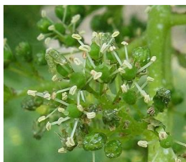
50% Floraison (I-23)