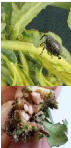
Charançon du bourgeon terminal adulte (en haut) et larves (en bas), qui provoquent la nuisibilité par une absence de tige principale au printemps