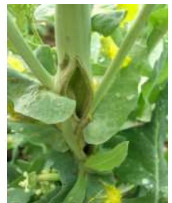
Dégât engendré par le charançon de la tige du colza lors de la ponte

Seul 1 individu de charançon de la tige du colza est piégé dans une parcelle de l'Aude. Hors réseau, d'autres piégeages de faible intensité ont pu être observés dans plusieurs départements.