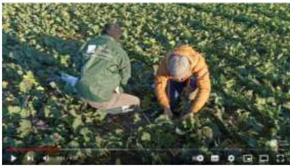
Lien vidéo pesée biomasse Terres Inovia

Il est toujours temps de réaliser la pesée biomasse sortie hiver afin de calculer la juste dose d'apport d'azote à la culture.