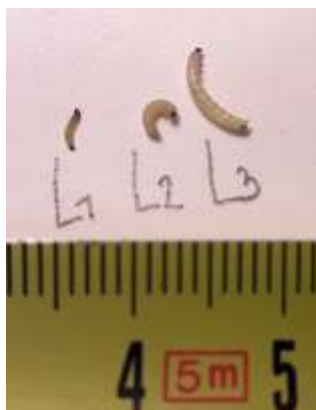
Stades larvaires de grosses altises