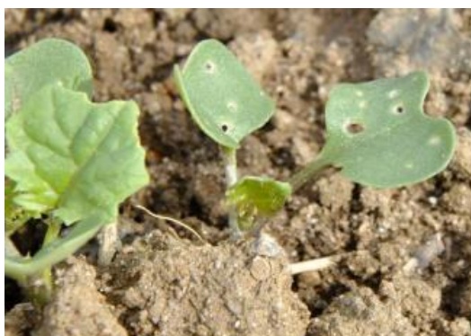
Moins de 25 % de la surface touchée

Seuil indicatif de risque : 8 pieds sur 10 présentant des morsures sans dépasser 1/4 de la surface végétative.