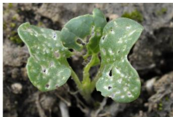
Plus de 25 % de la surface touchée