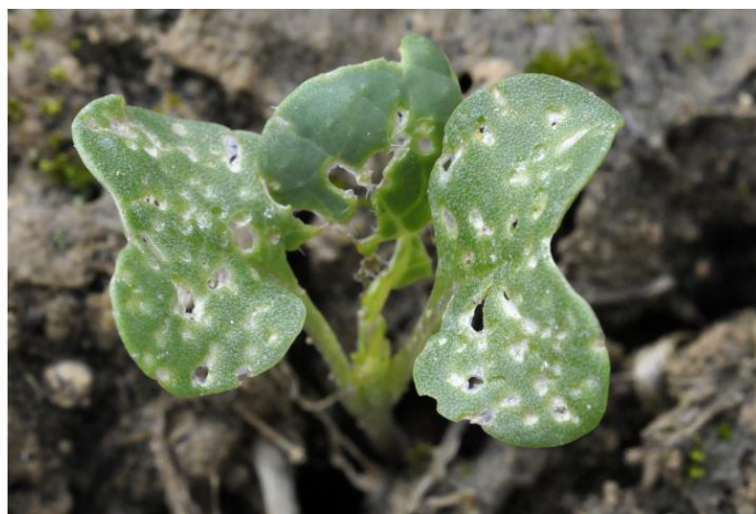
Plus de 25 % de la surface touchée