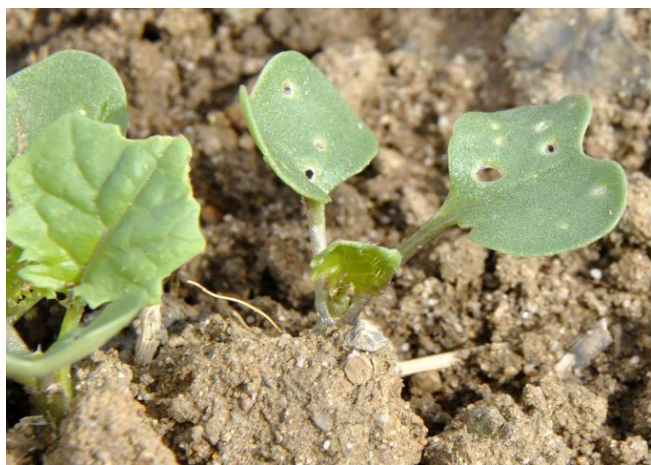
Moins de 25 % de la surface touchée

Seuil indicatif de risque : 8 pieds sur 10 présentant des morsures sans dépasser ¼ de la surface végétative.