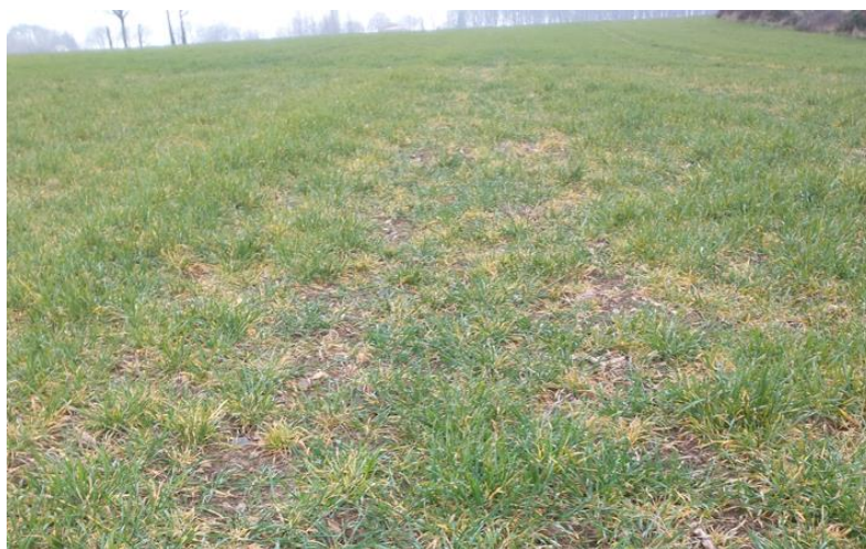
Orge 22/02/2023 « sortie d'hiver » (Creuse) - Dégâts JNO

On observe un développement irrégulier des plantes (marquant les zones où les pucerons étaient présents à l'automne) et qui restent rabougries (nanisme).