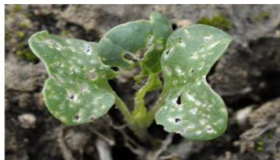
Plus de 25 % de la surface touchée