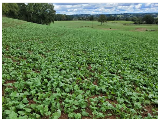
Parcelle d'Eyjeaux Semis le 24/08/2023

Des traitements molluscicides réalisés ont pu avoir un impact sur une partie de ces résultats.