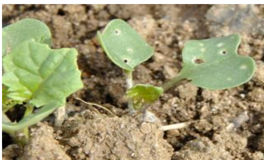
Moins de 25 % de la surface touchée

Seuil indicatif de risque : 8 pieds sur 10 présentant des morsures sans dépasser ¼ de la surface végétative.