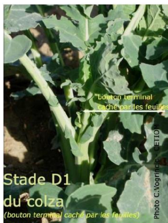
Figure 1 : Stade D1 : boutons accolés encore cachés par les feuilles terminales.

Stade F1 BBCH60 : 50 % des plantes avec au moins une fleur ouverte.