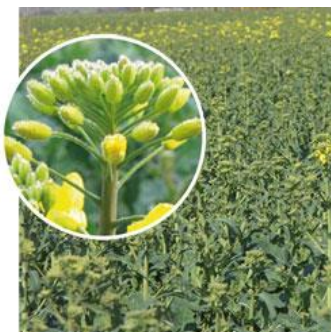
Figure 2 : Stade F1 : 50 % des plantes avec au moins une fleur ouverte