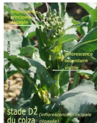
Figure 2 : Stade D2 : Inflorescence principale dégagée et boutons accolés. Inflorescences secondaires visibles.