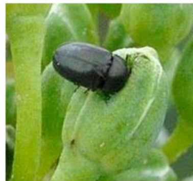
Méligèthe perforant un bouton floral pour s'alimenter

2 parcelles au stade D1 et en bon état végétatif, de l'Ariège et de la Dordogne signalent plus d'une dizaine d'insectes par plante. Ailleurs, sur les parcelles à D2-E, le nombre moyen d'insectes par plantes s'établi entre 1 et 3 (1 parcelle à 7 individus par plante).