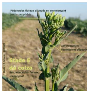
Figure 2 : Stade E : Boutons séparés. Les pédoncules floraux s'allongent en commençant par ceux de la périphérie.