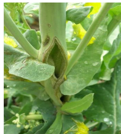
Dégât engendré par le charançon de la tige du colza lors de la ponte

Les captures du charançon de la tige du chou (non nuisible du colza) suivent la même tendance avec 6 parcelles sur 13 indiquant sa présence. Concernant cet insecte, le nombre d'individus capturés peut rester parfois important, avec plusieurs dizaines, voire plus d'une centaine d'insectes par cuvette.