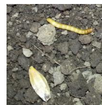
Larve de Taupins près d'un grain d'orge

Observations : pas de dégâts signalés sur les premiers semis pour le moment, mais des larves sont observées dans les lignes de semis (Talais 33).