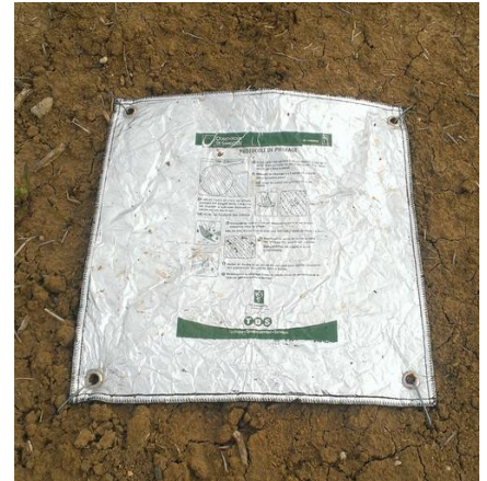
Piège à limaces