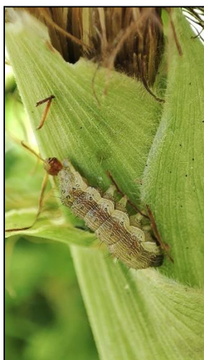
Jeune chenille (Saint-Pée-sur-Nivelle)