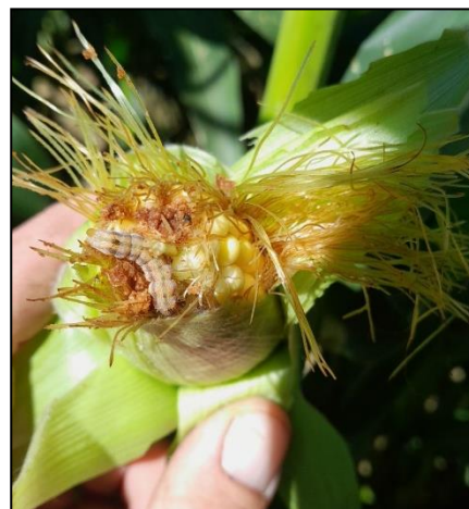
Chenilles à un stade de développement avancé (Abense-de-Haut)

Des chenilles Héliothis, à plusieurs stades de développement, ont été repérées sur des parcelles de maïs à Saint-Pée-sur-Nivelle et Abense-de-Haut. Causant des dommages sur les épis de maïs doux, maïs semences et haricots verts, il faut faire preuve de vigilance sur ces cultures.