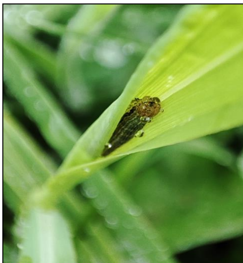
Chenille observée à Arette (2 cm)

Lors de la tournée de cette semaine, quelques traces de morsures ont été observées à ARETTE, GARINDEIN, JUXUE, HASPARREN, LOUHOSSOA, ITXASSOU et SAINT-PEE-SUR-NIVELLE.