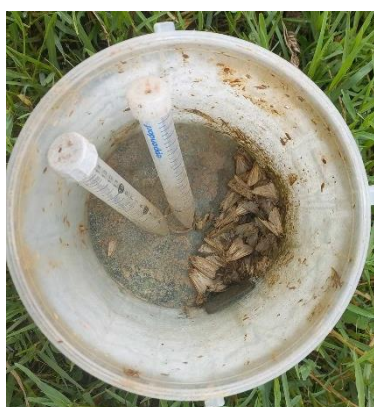
Piège alimentaire de BIDARRAY le 1 er septembre 2024 avec principalement des papillons cirphis

Pour la semaine du 1er septembre, des papillons ont été capturés dans les pièges sur sept sites : ESQUIULE (3), CAMBO (4), GARINDEIN (36 dont 21 femelles et 15 mâles), JUXUE (5 dont 5 femelles et 0 mâle), BIDARRAY (29 dont 12 femelles et 17 mâles), ITXASSOU (1) et LOUHOSSOA (2).