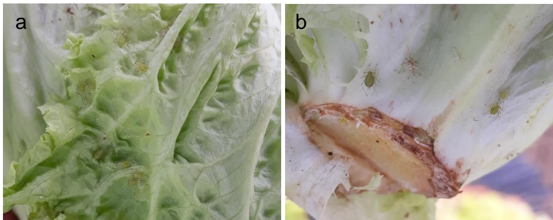
Pucerons sur salades (a et b)

Quelques sites avec présence de pucerons allant jusqu'à 20% des plants touchés.