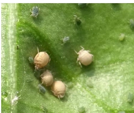
Momies de pucerons