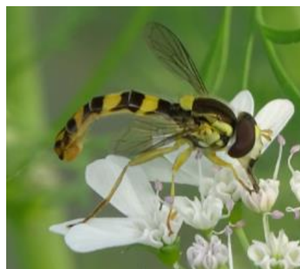
Adulte de syrphe