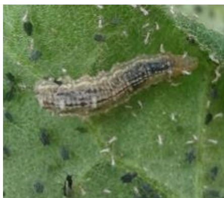
Larve de syrphe