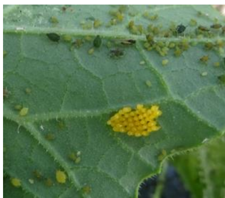
Ponte de coccinelle