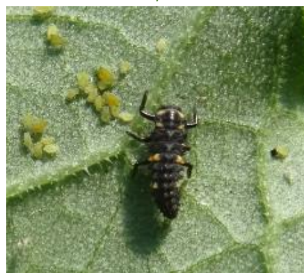
Larve de coccinelle