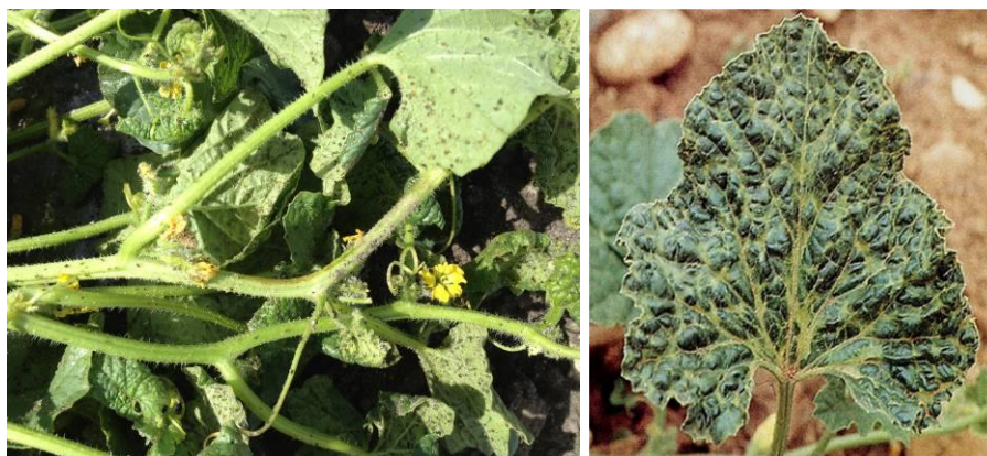
Foyer de pucerons observé et risque de viroses (ici ZYMV sur feuille)

Évaluation du risque : avec l'observation de quelques individus, le risque est présent. Au débâchage ou sous les couvertures, une surveillance attentive doit être mise en place (surtout face à la difficulté de repérer les premiers foyers sous les petits tunnels).