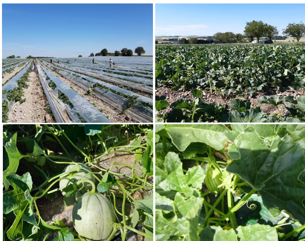
Des débâchages sont en cours pour les plantations jusqu'à la semaine 17, les cultures sont saines, précoces (ici début des écritures)